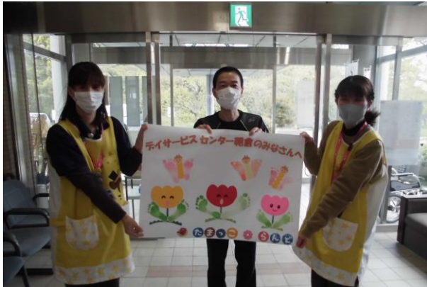
デイサービスセンター朝倉