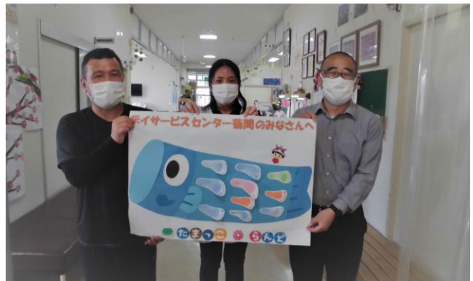
デイサービスセンター菊間